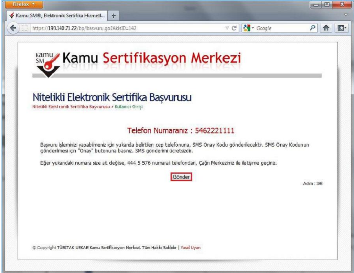
Şekil 3 - SMS Onay Kodu Gönderim Ekranı

Form onaylandıktan sonra SMS Onay Kodu gönderim ekranı (Şekil 3) görüntülenecektir. Başvuru formunu doldururken Cep Telefonu alanına girdiğimiz Cep Telefonu numarası görüntülenir. Gönder butonuna basıldığında ekranda görüntülenen cep telefonu numarasına SMS Onay Kodu gider.